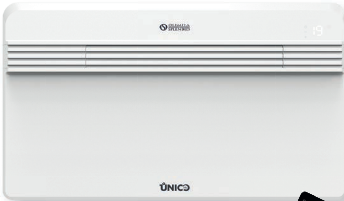
Design by Matteo Thun & Antonio Rodriguez