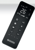
Telecomando di serie